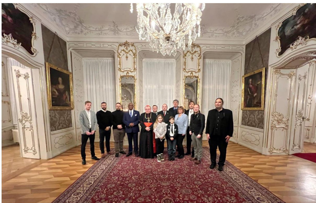
Přijetí J. Em. Dominikem kardinálem Dukou v Arcibiskupském paláci v Praze na Hradčanském náměstí