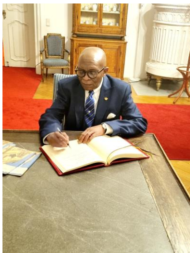
J. K. V. YUHI VI., titulární král Rwandy