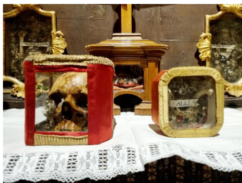
Ostatky sv. Othmara a sv. Galluse