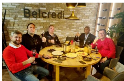
Společné setkání po přeletu