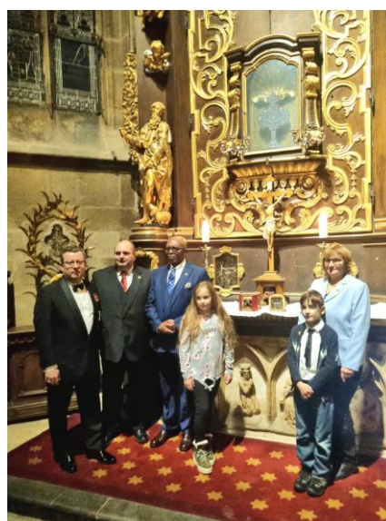
Kaple svatých Ostatků v Katedrále sv. Víta