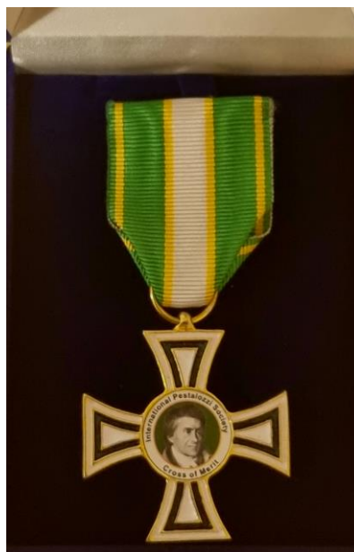
Dekret a insignie ocenění Cross of Merit of the International Pestalozzi Society.