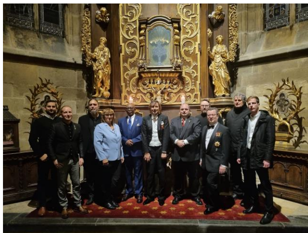
Před ostatkovým oltářem v Kapli svatých Ostatků